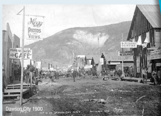
Dawson City 1900

Après le déjeuner, nous irons faire un tour de bateau sur la rivière Tanana et Chena à bord d'une réplique d'un bateau à aubes, comme à l'époque de la découverte de l'or à Fairbanks, en 1902. Cette croisière nous permettra de découvrir la région de Fairbanks, en plus de visiter un village amérindien et inuit de la tribu Athabascan. Après le dîner, nous ferons un bref tour de ville de Fairbanks , puis un arrêt à North Pole, Alaska , soit la résidence du Père Noël. En raison des multiples activités organisées dans cette région durant le temps de Noël, les résidents ont décidé de baptiser leur village North Pole. Depuis ce temps, les touristes arrêtent en grand nombre pour se faire photographier devant le gigantesque Père Noël et pour acheter bien sûr des décorations de Noël. Ce soir, nous nous rendrons à « Alaskaland » pour un succulent repas de saumon frais et de steak cuit sur charbon de bois. Nous nous régalerons sûrement! De retour à l'hôtel vers 20 h. PD - S