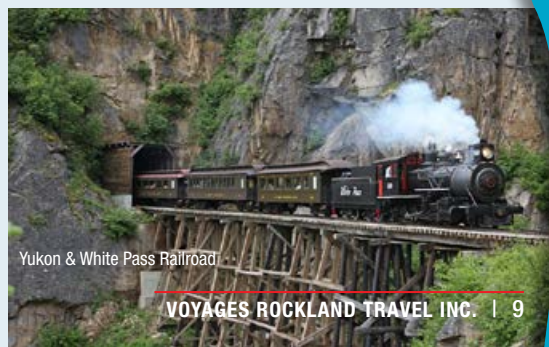
Yukon & White Pass Railroad